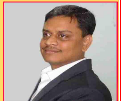
एस. राजलिंगम जिलाधिकारी